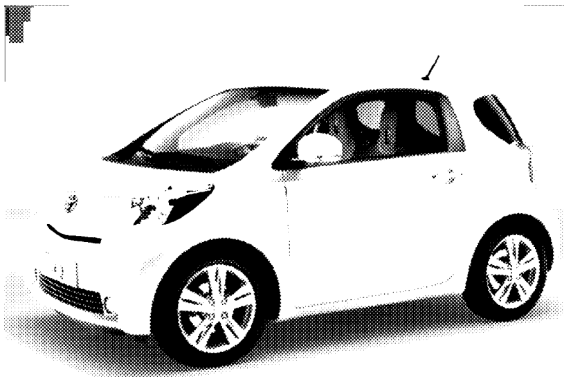
Toyota iQ

Tags: airp , auto ecologiche , bologna Lascia un commento