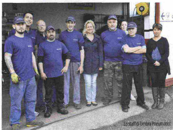
Lo staff di Umbria Pneumatici

titolari dell'azienda. Il settore del pneumatico ricostruito vanta una forza particolare nei ricambi per flotte postali, mezzi pesanti, veicoli commerciali, taxi, pneumatici invernali e off-road ed è oggi sempre di più un elemento di sicuro risparmio economico. Sebbene oggi la grande sfida sia competere con il fiorente mercato di pneumatici economici nuovi di provenienza asiatica, c'è da considerare il grande beneficio ecologico per l'ambiente costituito dal riciclo di gomme usate. La ricostruzione di pneumatici in Italia ha permesso un risparmio complessivo stimato in 297 milioni di euro, 33 mila tonnellate di gomme usate all'ambiente, 40 mila tonnellate di CO 2 , 32 mila tonnellate di materie prime e 114 milioni di litri di petrolio (dati AIRP