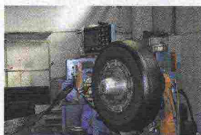
Preparazione della carcassa prima della ricostruzione