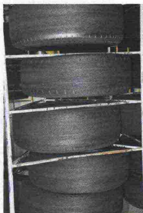
Le carcasse ispezionate e pronte per la lavorazione

INFO: Tel. 075-9885609 www.umbriapneumatici.it