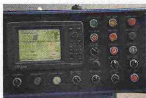
Macchine a controllo numerico usate in produzione