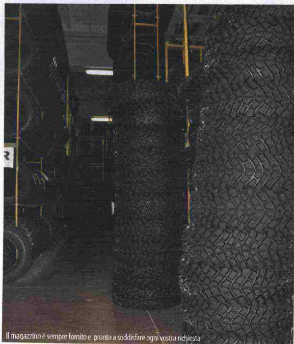
Il magazzino è sempre fornito e pronto a soddisfare ogni vostra richiesta

Sicuramente di una espansione e diffusione più capillare del prodotto sul territorio nazionale. Noi siamo online per offrire ai clienti la qualità e il risparmio nella ricostruzione gomme nel segno del made in Italy.