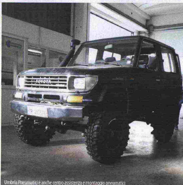
Umbria Pneumatici è anche centro assistenza e montaggio pneumatici