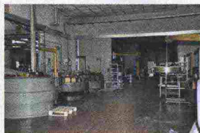
Le presse che applicano il battistrada