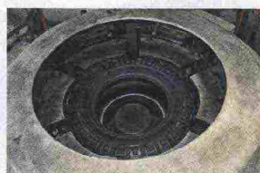
Il battistrada si salda sulla carcassa