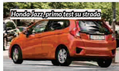
Honda Jazz, primo test su strada