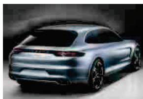
Porsche Pajun al Salone di Francoforte?