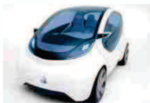
Apple assume manager di Fiat Chrysler Automobiles