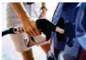
A giugno +6% di consumi di benzina e gasolio auto