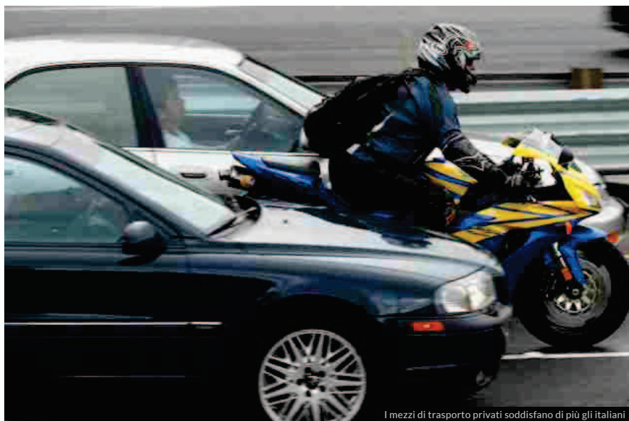
I mezzi di trasporto privati soddisfano di più gli italiani