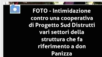
FOTO - Intimidazione contro una cooperativa di Progetto Sud Distrutti vari settori della struttura che fa riferimento a don Panizza