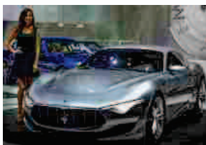
Maserati al salone di Los Angeles

Wester: "Questo è un momento straordinario per Maserati, il nostro prodotto è proiettato verso una copertura sempre più ampia"