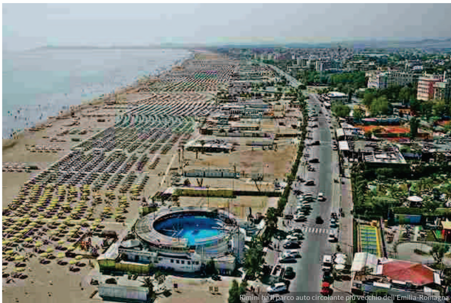
Rimini ha il parco auto circolante più vecchio dell'Emilia-Romagna