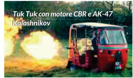
Tuk Tuk con motore CBR e AK-47 Kalashnikov