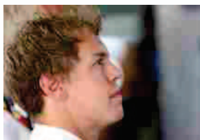
Vettel alla Ferrari annuncio ufficiale

455 cavalli e 603 Nm di coppia, accelerazione da 0 a 100 km/h in 3"9 e velocità massima di 299 km/h