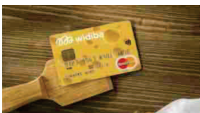
Conto Corrente Zero Spese

"Benvenuto Sebastian - Vettel e Raikkonen la coppia del 2015". Il driver "per me è il sogno di una vita che si avvera"