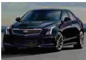
Cadillac ATS-V, V-Series Twin Turbo

Wester: "Questo è un momento straordinario per Maserati, il nostro prodotto è proiettato verso una copertura sempre più ampia"