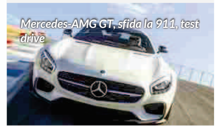
Mercedes-AMG GT, sfida la 911, test drive