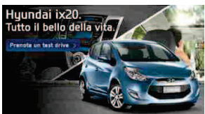
Hyundai ix20 a €12.750

Apri Conto Widiba: Zero Canone, Zero Bolli e il 2,10% Lordo Annuo