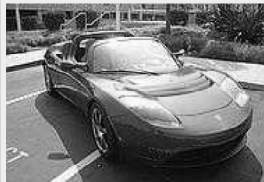
Tesla Roadster, l'auto elettrica prodotta dalla Tesla Motors